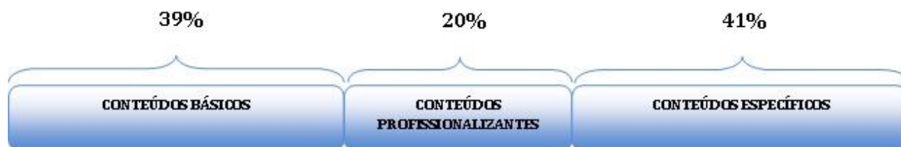
Figura 1- Distribuição de conteúdos

Considerando uma visão integradora e sistêmica do conhecimento, numa perspectiva que tende aos preceitos de ciência unificada de Capra (2001), a Figura 2 apresenta o perfil holístico de formação do egresso. Observa-se a clara interseção de todos os conteúdos, imersos na realização de projetos multidisciplinares integradores, culminando na realização do estágio e trabalho de conclusão de curso.