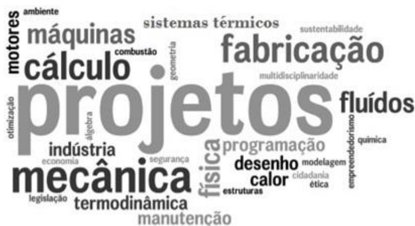
Figura 3- Nuvem de palavras segundo a matriz curricular.

Por fim, apresentam-se na Figura 3 os termos mais comuns, segundo os conteúdos didáticos da matriz curricular, previstos no perfil de formação do egresso em engenharia mecânica.