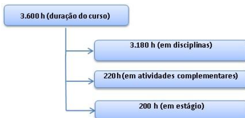
Figura 4 - Plano de integralização da carga horária

Em relação ao elenco de disciplinas oferecidas no curso, conforme os núcleos de conteúdos, têm-se a sua distribuição detalhada nos Quadro 2, Quadro 3 e Quadro 4.