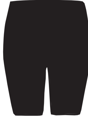
Bermuda Modelo Feminino