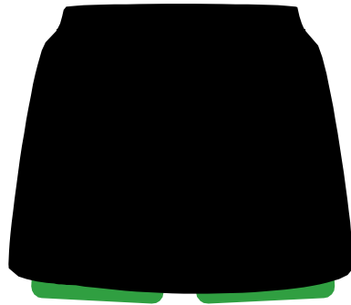
Short Saia Modelo Feminino