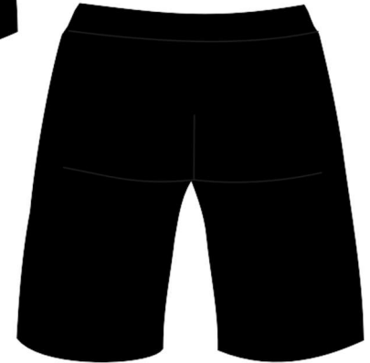
Bermuda Modelo Masculino