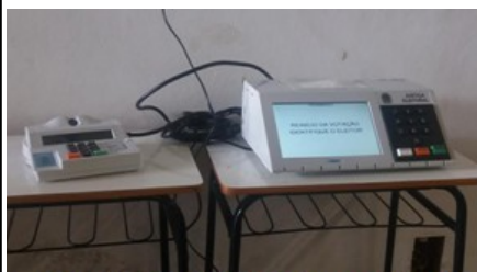
Urna eletrônica utilizada no Evento