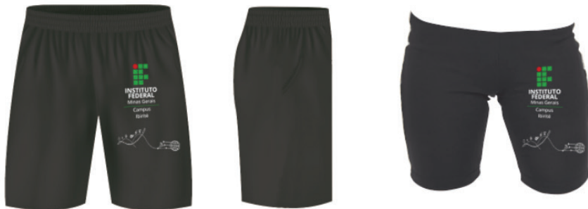
Figura 4 - Bermuda

Símbolo: em Silk ou Bordado na cor branca, cor em conformidade com o Manual de Identidade Visual do IFMG, localizada conforme figura ao lado.