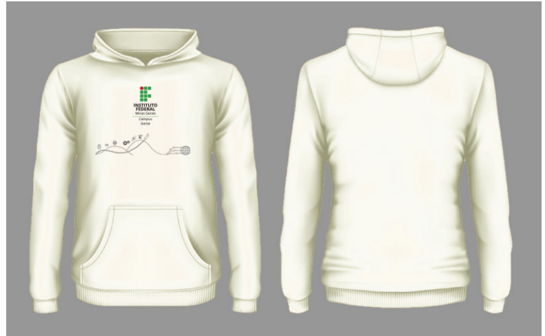
Figura 7 - Jaqueta com capuz

Símbolo: em Silk ou Bordado na cor cinza K:50, cor em conformidade com o Manual de Identidade Visual do IFMG, localizada conforme figura ao lado.