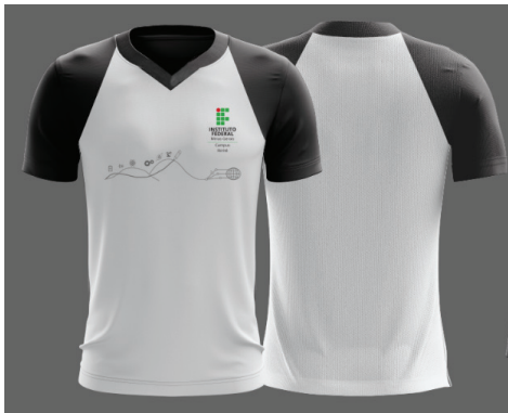
Figura 1 - Camisa de uso diário

Símbolo: em Silk ou Bordado na cor cinza K:50, cor em conformidade com o Manual de Identidade Visual do IFMG, localizada conforme Figura 1 ao lado.