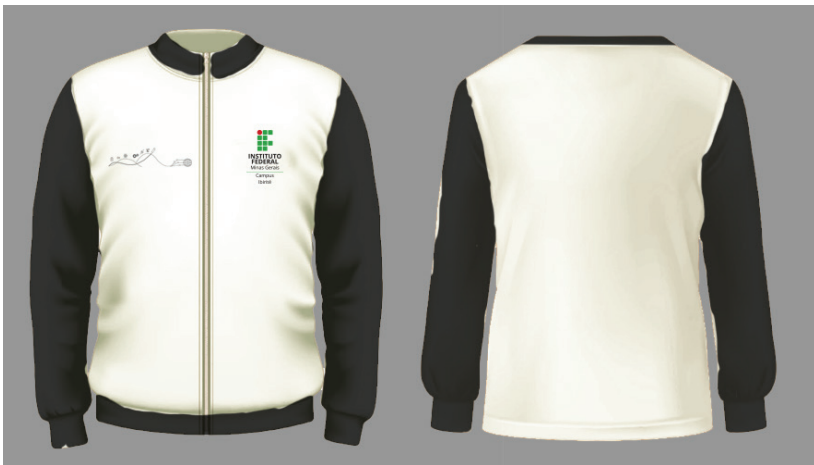
Figura 6 - Jaqueta com fecho

Símbolo: em Silk ou Bordado na cor cinza K:50, cor em conformidade com o Manual de Identidade Visual do IFMG, localizada conforme figura ao lado.