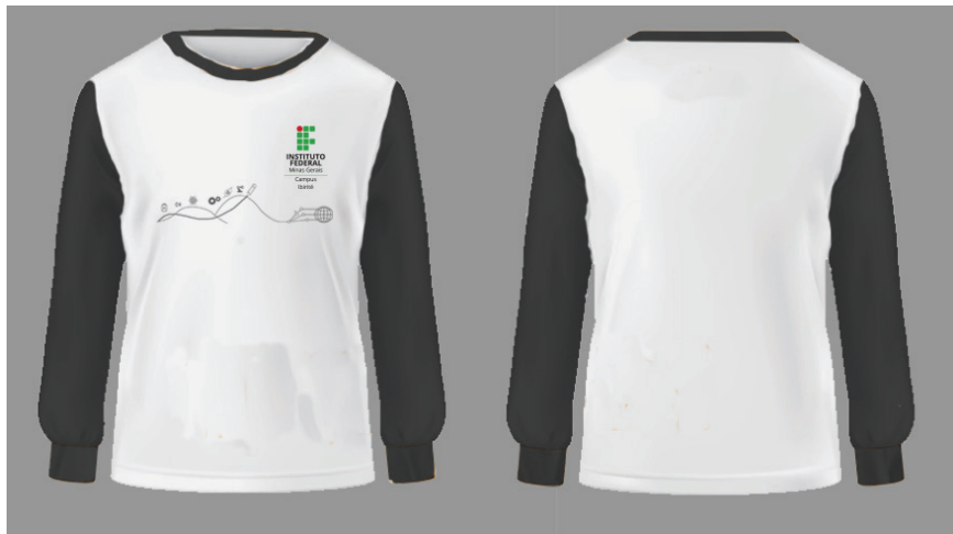
Figura 5 - Camisa de manga longa

Símbolo: em Silk ou Bordado na cor cinza K:50, cor em conformidade com o Manual de Identidade Visual do IFMG, localizada conforme figura ao lado.