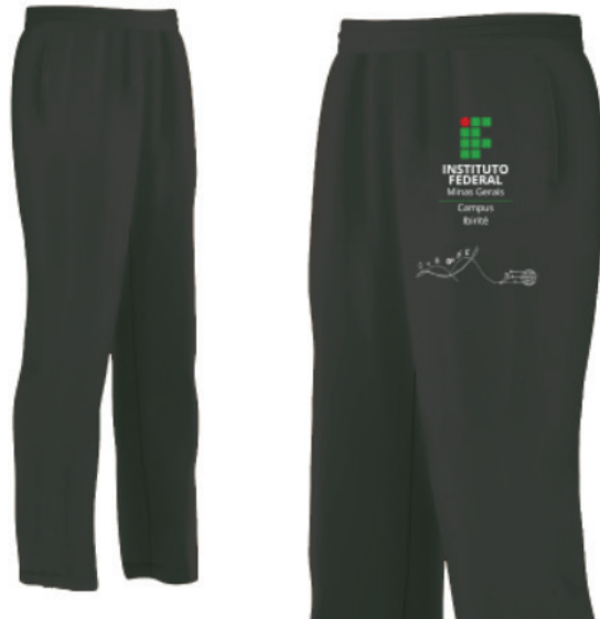
Figura 3 - Calça

Símbolo: em Silk ou Bordado na cor branca, cor em conformidade com o Manual de Identidade Visual do IFMG, localizada conforme figura ao lado.