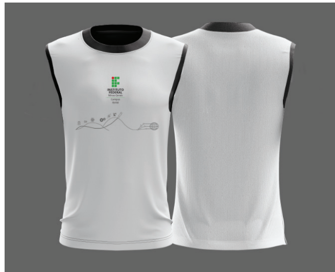
Figura 2 - Camiseta

Símbolo: em Silk ou Bordado na cor cinza K:50, cor em conformidade com o Manual de Identidade Visual do IFMG, localizada conforme Figura ao lado.