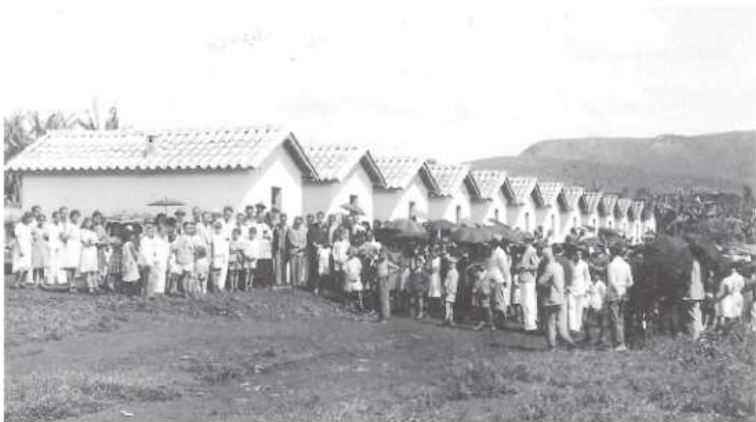
As primeiras 'casinhas' da SSVP em Piumhi inauguradas em 1942