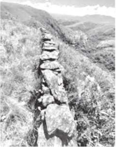
Termo de abertura do Livro de Registro de Terras da Vila de Piumhi (1855), alto; acima, muro de pedras edificado por escravos na serra do Andaime

Muitos escravos sob o escaldante sol e, certamente, pelo incentivo do chicote davam os toques na construção desses belos monumentos históricos. As marcas dos relhos e dos açoites deixavam nos cativos profundas cicatrizes: na pele e principalmente na alma. Asso-