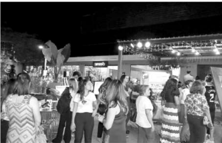
Em maio deste ano, a mostra do projeto acontece no Pérola Negra Center