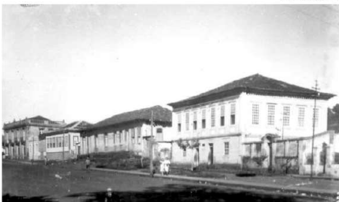
À direita, a primeira sede da municipalidade piumhiense o antigo casarão na praça Dr. Avelino de Queiroz demolido na década de 70

Com o advento da Proclamação da República, ocorrida em 15 de novembro de 1889, surgiram algumas mudanças. A Câmara Municipal na Primeira República ou República Velha funcionou até 1930, quando Getúlio Vargas ascendeu ao poder federal por força da Revolução de 1930. O novo