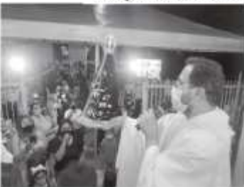
PARÓQUIA SANTO ANTÔNIO

sa forma, a construção da nova igreja se deu por iniciativa dos próprios leigos que se organizaram em comissões de campanhas, de festas, de fiscalização da construção, de mutirões, entre outras. Eram os membros das comissões que angariavam recursos e que os aplicavam na execução da obra. O padre acompanhava tudo, mas deixava que a comunidade tomasse as suas próprias decisões.