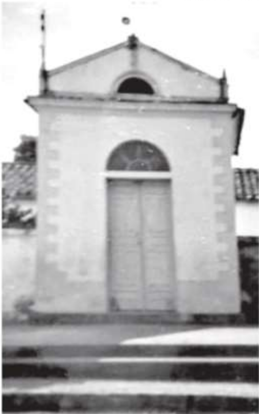
A Capelinha de N Sra. Aparecida erguida em 1930