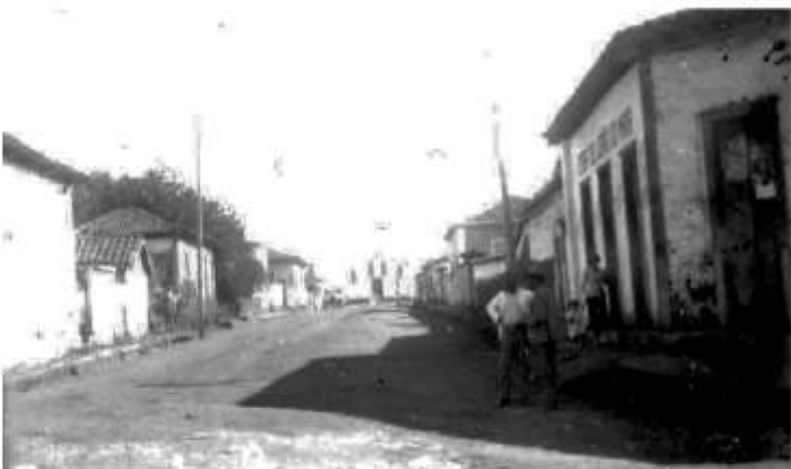
A antiga rua do Rosário na Piumhi do início do século passado

Depois de algum tempo Machado de Mello se tocou e percebeu a maldade que cometera e com receio da morte e ter contas