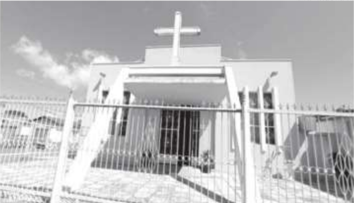
Aspecto atual da Igreja Nossa Senhora Aparecida (acima); com a devoção iniciada na década de 1920, capela erguida em 1930 e reconstruída nos anos 1980/1990, início da novena anual em 1992, hoje a Festa de Nossa Senhora Aparecida (direita) tradicional em Piumhi.

Nesse espírito de comunidade e valorização da importância do leigo na vida prática da Igreja, o pároco colocou o empreendimento da construção da nova capela nas mãos das principais lideranças da Comunidade Santa Cruz. Des-