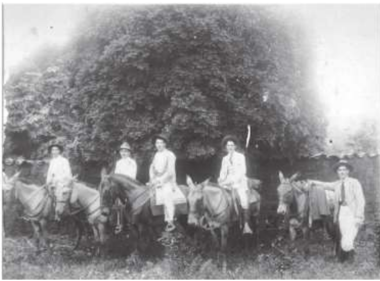
cinco cavaleiros piumhienses em 1938. Observe a elegância dos montadores e imponência dos animais numa época em que a cena era comum em nossa Piumhi...

Como prêmio ao cavaleiro do cavalo vencedor seria oferecida uma linda estatueta do cavalo “Mossoró”, considerado “o Rei dos Cavalos Brasileiros”. Ao segundo colocado seria reservado “um valioso prêmio”. Os prêmios