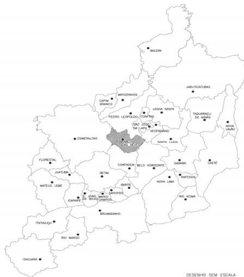
Figura 1: Ribeirão das Neves na Região Metropolitana de Belo Horizonte

Esmeraldas e Vespasiano. As vias de acesso que servem ao município são a BR 040, MG 424 e MG 432. A figura 1 apresenta a localização da cidade na região metropolitana de Belo Horizonte.