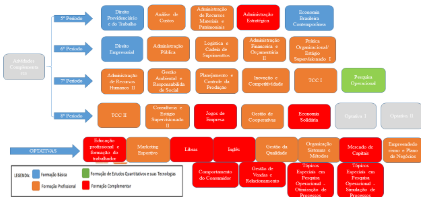
Representação gráfica do perfil de formação do 5º ao 8º período, incluindo Optativas

O ingresso nos cursos de graduação ofertados pelo IFMG se dá por meio de processo seletivo ou pelos processos de transferência e obtenção de novo título previstos no Regulamento de Ensino dos Cursos de Graduação, observadas as exigências definidas em edital específico.