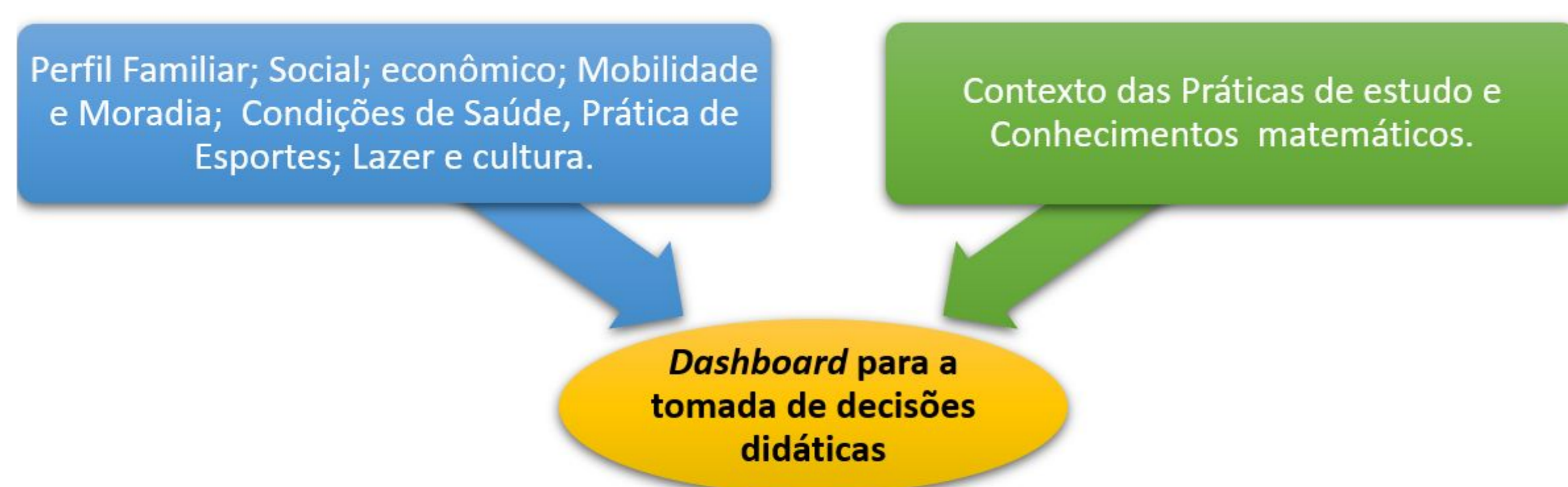
Figura 1 - Partes constituintes do mapeamento

Os estudantes dos cursos Técnicos integrados ao Ensino Médio do campus IFMG Ribeirão das Neves são os sujeitos da pesquisa e para mapeamento, propõe-se o conhecimento das seguintes características: