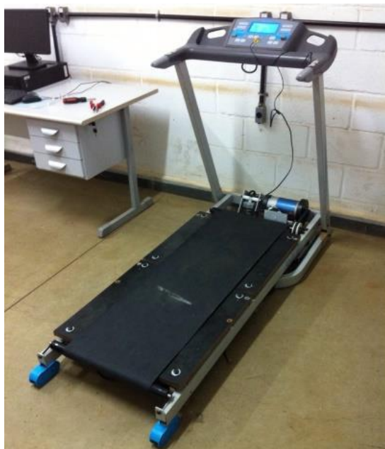
FIGURA 6. Esteira Montada

A figura 6, por sua vez, representa a esteira montada com as respectivas adaptações. As plataformas foram fixadas na armação da esteira utilizando parafusos de 12 x 35 mm e 12 x 90 mm. Observou-se que houve um aumento de ruído durante o funcionamento, no entanto, a esteira continuou funcionando normalmente.