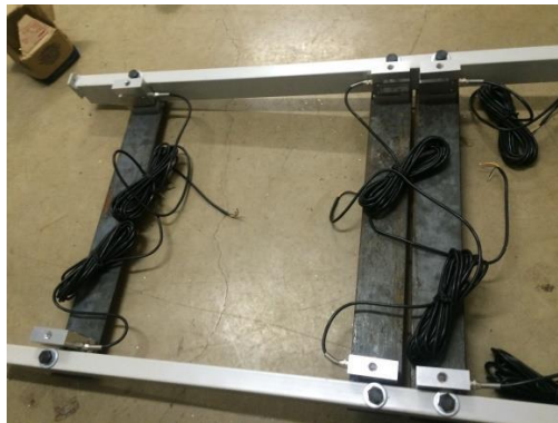
FIGURA 4. Perfis metálicos adaptados na armação da esteira com as células de carga

Finalizado o desenho mecânico, foi possível iniciar a montagem do suporte de adaptação das plataformas de força. Na montagem da plataforma de força, utilizaram-se perfis de aço de espessura de 3 mm para a sustentação da chapa e das células de carga SCSA/ZL-200 com capacidade de 200 kgf da MK Controle e Instrumentação LTDA (Fig. 4). A chapa de madeira que veio de fábrica foi dividida em duas. Em cada uma, foram adaptadas quatro células de carga e estas foram fixadas em dois perfis de aço de 3 mm.