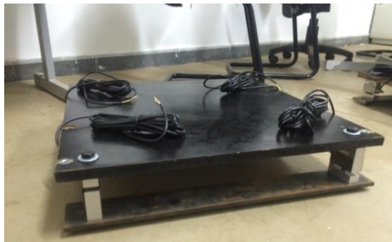
FIGURA 5. Plataforma de força montada

O desenho mecânico tridimensional feito no programa Solid Edge® ajudou no desenvolvimento das plataformas de força e na montagem da esteira. Houve algumas dificuldades para a construção como o estabelecimento de parâmetros de modificações na estrutura, a montagem das plataformas e também quanto à chapa de madeira. Na figura 5, observa-se a montagem de uma das plataformas a serem adaptadas na esteira.