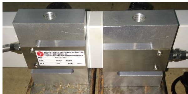
FIGURA 2. Célula de carga selecionada

Além disso, foram feitos cálculos para encontrar qual seria a célula de carga adequada que atenderia melhor ao que seria necessário no projeto (fig. 2).