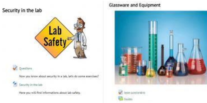
Figura 1 – Interface da plataforma Moodle, módulos 1 (Security in the lab) e 2 (Glassware and Equipment)

A imagem acima é dos módulos 1 e 2, respectivamente, que representa o layout escolhido para cada um deles. Cada um dos módulos têm suas devidas atividades e utilizam os recursos disponíveis no Moodle. De forma geral, os módulos criados no período contam com texto teórico, atividades e fórum para dúvidas.