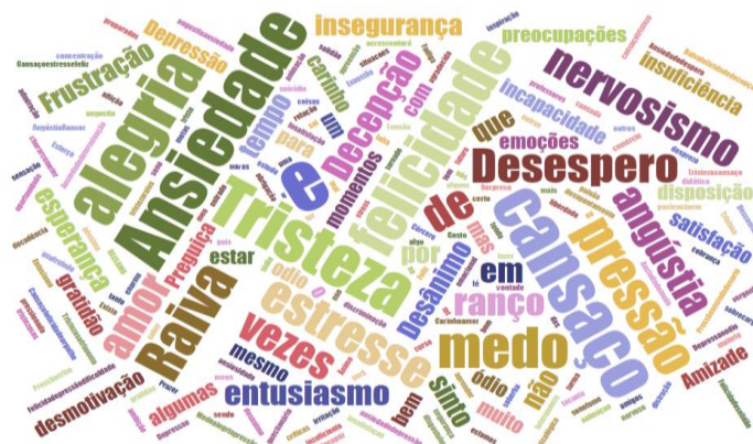
Figura 1: Emoções e Sentimentos em relação ao contexto escolar

A primeira análise diz respeito às emoções e sentimentos relacionados ao contexto escolar em que os alunos se encontram. A nuvem abaixo nos mostra os itens lexicais mais frequentes em evidência, delimitando mais sentimentos e emoções negativas em relação à escola.